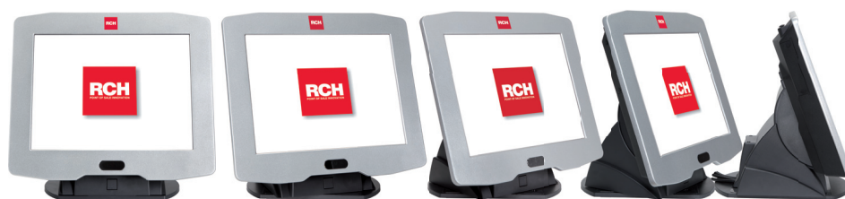
Monitor ruotabile di 90° a destra e a sinistra